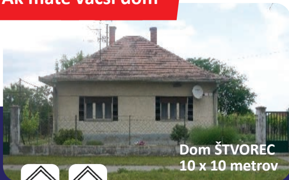
Dom ŠTVOREC 10 x 10 metrov