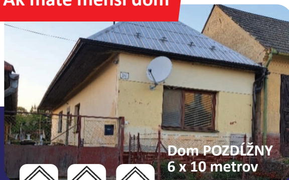
Dom POZDÍŽNY 6 x 10 metrov